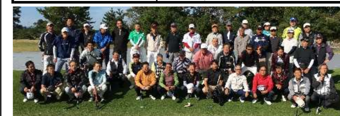
勿来工業高校OB会ゴルフコンペ参加者45名全員の写真です。