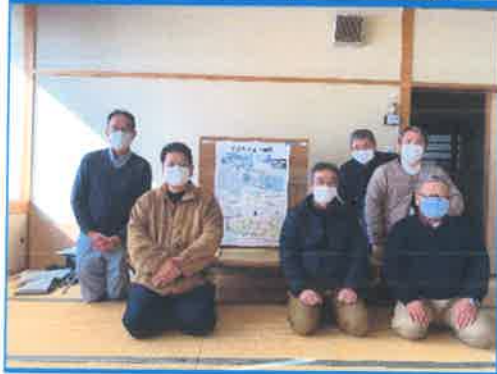
2月12日午前9時に卒業設計コンペ審査員6名が平労働福祉会館に集まり審査会が開催されました。

た。審査会が始まる前に、作品39点を写真に収めました。表彰式に作品集として卒業する皆さんへの配布のためです。会議室は和室が使用され、学校からお借りした、39名の作品を畳の上に一同に並べ審査員は、付箋を持ち優秀とみられる作品におおの図面に張り付けていく作業を行いました。審査員はひとり一人10名の優秀作品を選び、全員が選び終わると、付箋が貼られた作品をひとつのグループに集め順位を決めていく作業をしました。6人の審査員が話し合いながら2時間を掛けて選び出し10名の入選者を抽出することが出来ました。作品は最優秀賞を紹介しています。