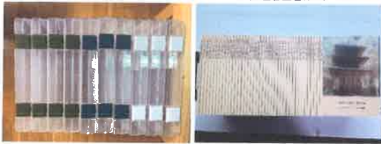
入選者表彰状ケース