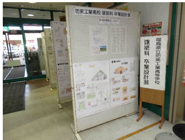
****令和4年度**** 設計コンペ展示会(マルト中岡店)