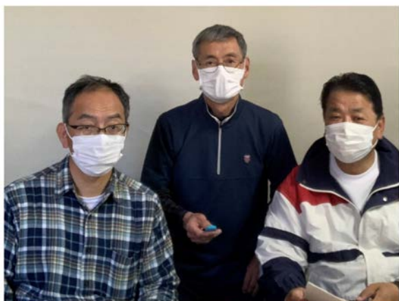
千葉設計事務所にて

案承認のお願いを添えて、通常総会資料として提供する内容を綴った資料8ページ分をセットにし、決議返信用ハガキと事務局だより第28号の3点をセットにしてB5サイズの封筒に詰める作業を3人で行いました。1回生から59回生の各回幹事109名に郵送する準備をしました。セットし終わった封筒は郵便局へ持ち込まれて、郵送の段取りをその日に整えました。